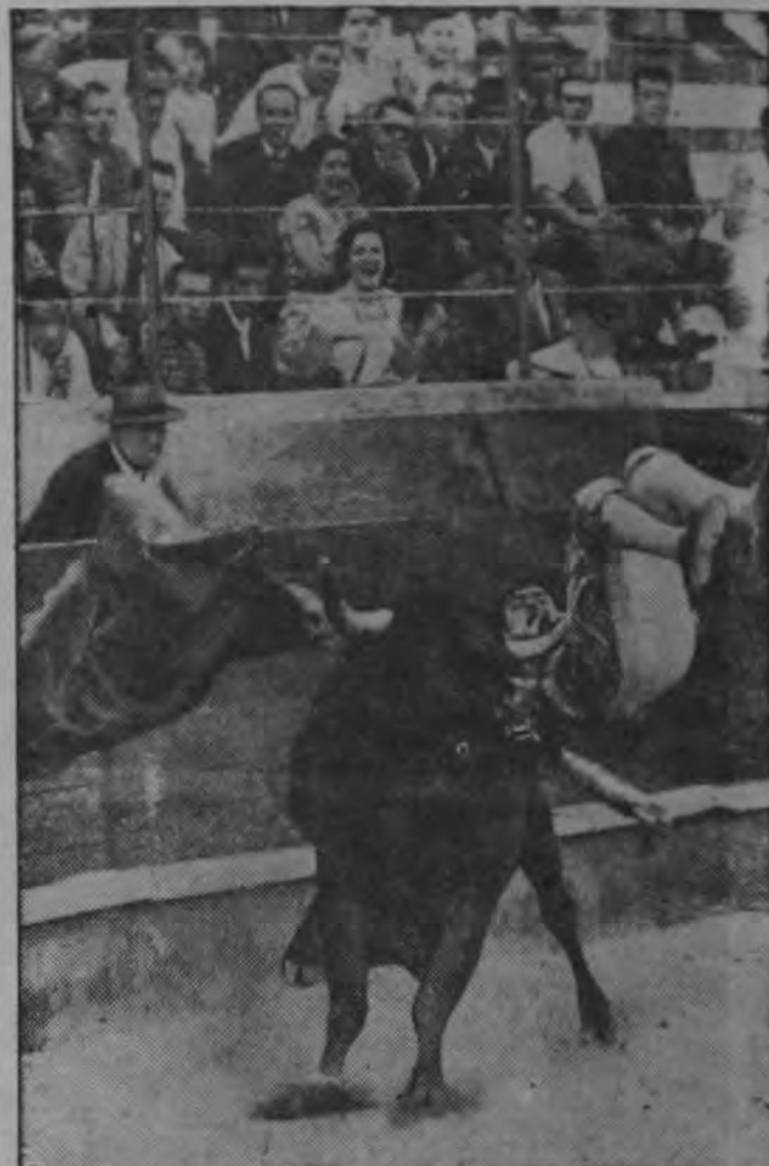
El torero Victoriano de la Serna, lanzado al aire por un toro en la plaza de Campo Pequeño en Lisboa. En los rostros de los espectadores se ven expresiones de terror. Afortunadamente el torero no sufrió lesiones graves.—(INP).

Por la Junta Nacional de Ciclismo Rodrigo Soto Badilla