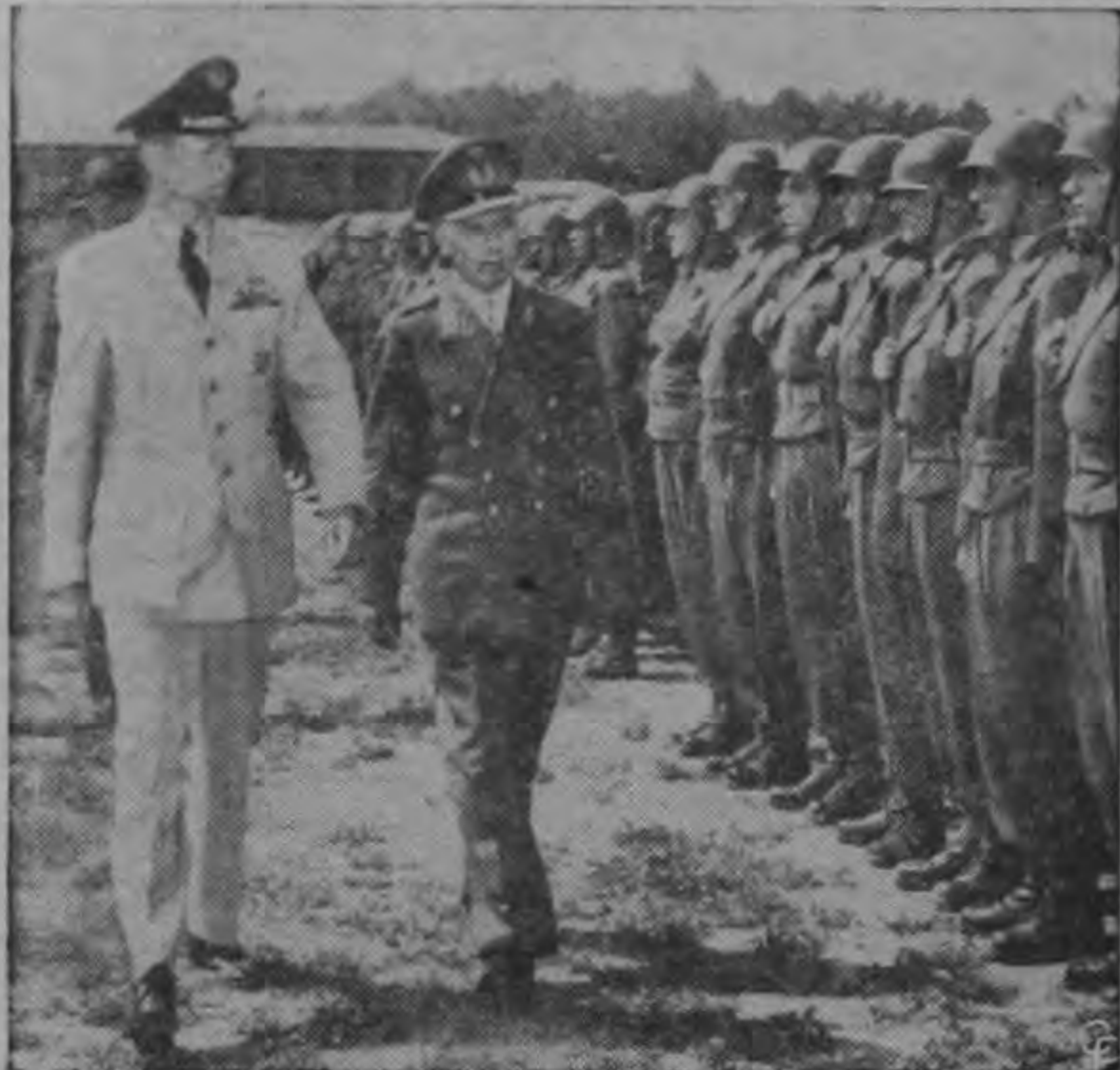
El General Lauris Norstad (izquierda) Supremo Comandante Aliado en Inspeccionar en Marburg, las primeras tropas de la Alemania Occidental que se suman a las fuerzas de la NATO. Tres divisiones se han añadido a la fuerza de la NATO.