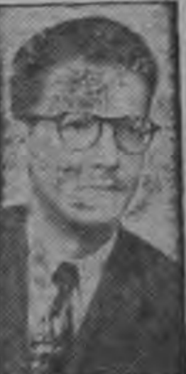
Benavides ...pro - educación...

En el Capítulo de Discusión de Dictámenes se aprobaron también los correspondientes a los siguientes proyectos: 1) Ratificación de las reformas al Segundo Convenio de San Salvador. Comité Internacional de Sanidad Apropuecuaría. 2) Ratificación del Tratado de Libre Comercio e Integración Económica entre Costa Rica y Guatemala.