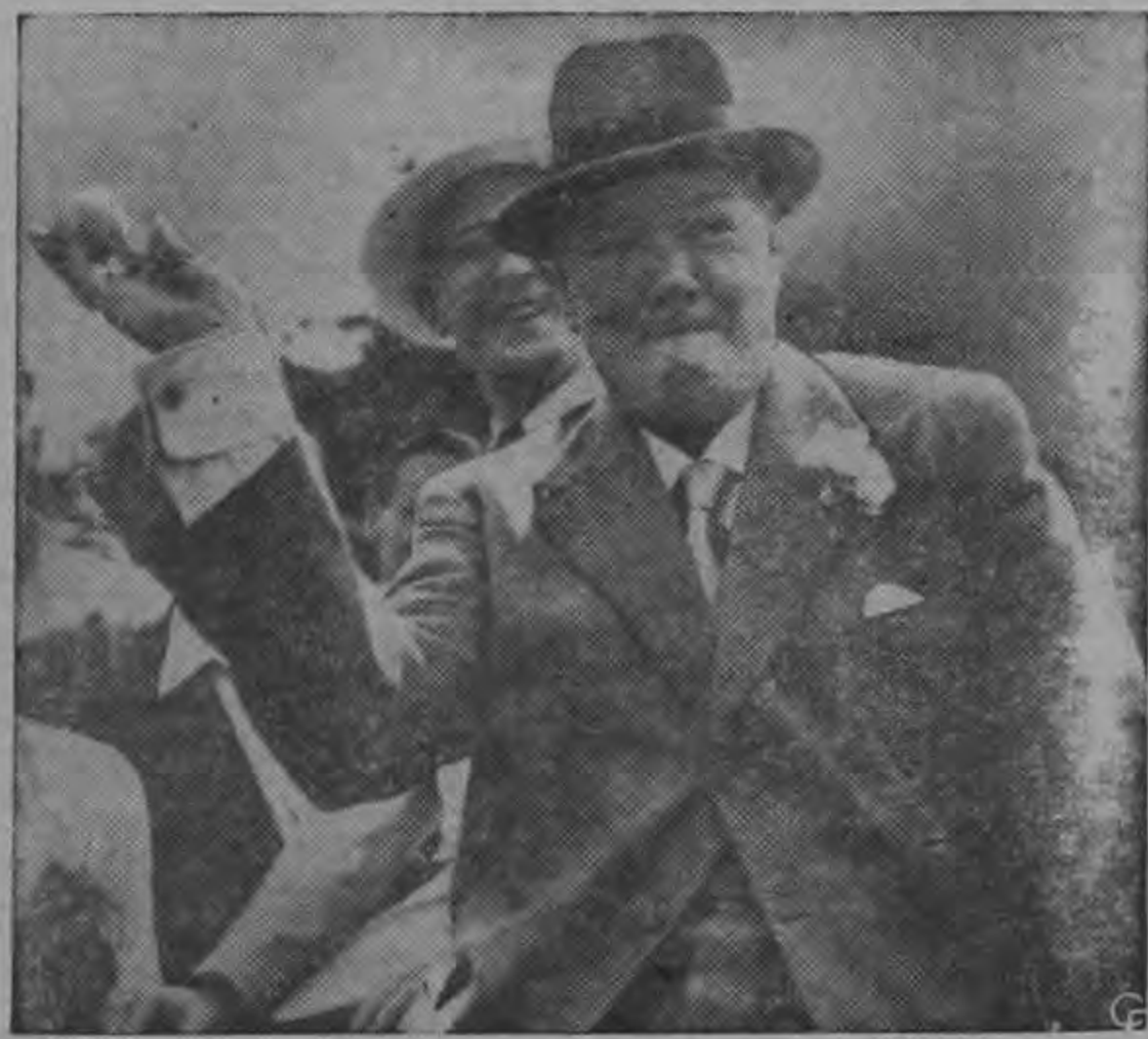
Sir Winston Churchill, de 82 años de edad, ex-Primer Ministro británico, lanza una bola a un blanco en la exhibición de "Sport Sally" durante la fiesta-jardin del Partido Conservador en Woodford, Inglaterra. Después de ganar algunos premios, Sir Winston habló sobre el uso de las armas nucleares.