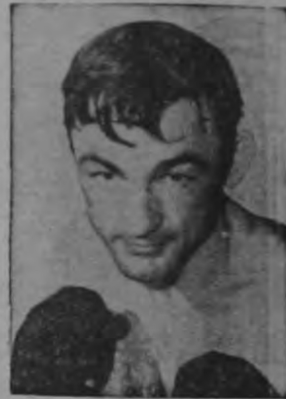
Por PAT ROBINSON

NUEVA YORK, Julio —(INS)—El campeonato mundial de boxeo peso medio, que se decidirá en un encuentro entre Sugar Ray Robinson y Carmen Basilio el próximo 23 de Septiembre, ya está eclipsando la contienda por el título de Campeón Mundial de todos los pesos, que Floyd Paterson y Hurricane Jackson se disputarán el 29 de Julio.